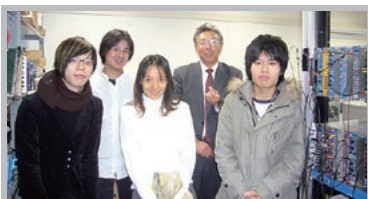
信州大学の高エネルギー物理学研究室のメンバー。

光が自分に落ちて来ると手を挙げる人の集団があるとしましょう。手を挙げた人の数を数えればこの部屋に光の粒子が落ちて来た数は分かります。光が来ると手を挙げる素子は今までにもありましたが、信州大学では更に感度を上げました。ただ感度を上げるとゴミに反応しても手を挙げてしまうので、ここでは一人一人を小さな部屋に隔離してゴミを寄せ付けない構造にしています。これがマルチピクセル光子検出器 (MPPC) の原理です。